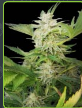
23 - Royal AK Automatic