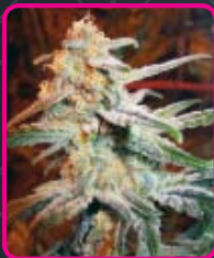
43 - Blue Mystic