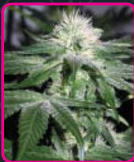
31 - Ice