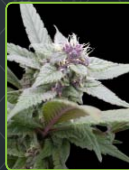
25 - Royal Bluematic