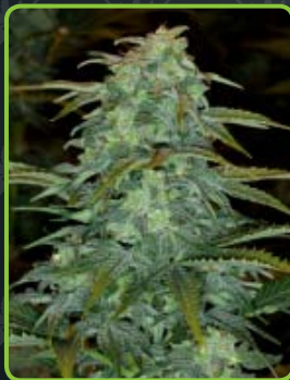
19 - Royal Haze Automatic