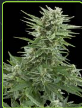
11 - Easy Bud