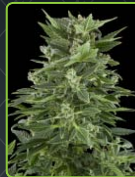
15 - Royal Automatic