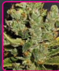
59 - Royal Cheese