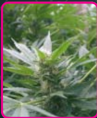
55 - Special Kush #1