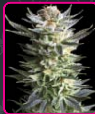
35 - Fruit Spirit