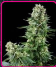
33 - White Widow