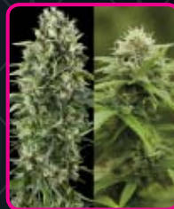
53 - Outdoor Mix