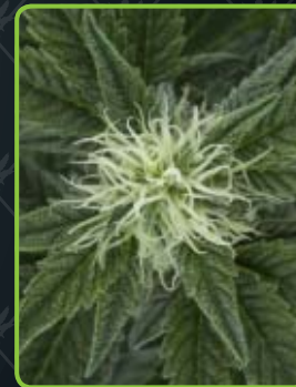
27 - Autoflowering Outdoor Mix