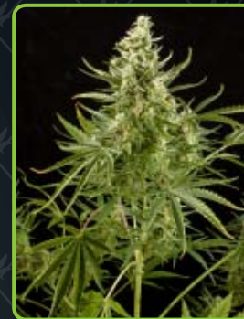
17 - Royal Critical Automatic