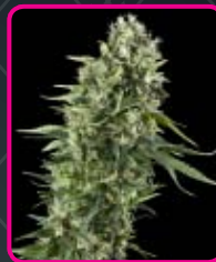
37 - Power Flower