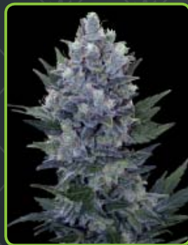
21 - Northern Light Automatic