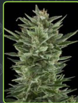
13 - Quick One