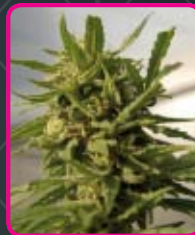
49 - Critical