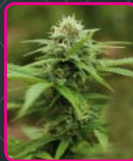
61 - Royal Moby