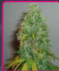
47 - Skunk #1