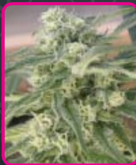
57 - Special Queen #1