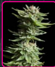
39 - Shining Silver Haze