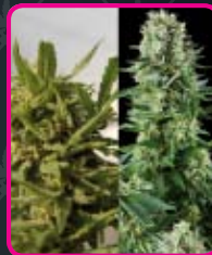
51 - Indoor Mix