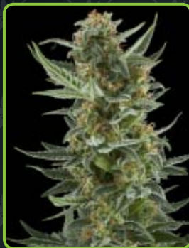
9 - Royal Dwarf