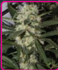
45 - Northern Light