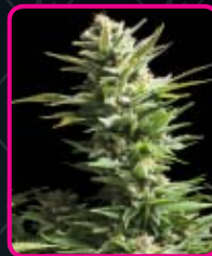
41 - Amnesia Haze